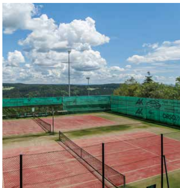
Freizeitangebot in der Umgebung.