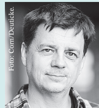
Radek Knapp österreichischer Schriftsteller