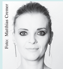
Moderation: Lisa Nimmervoll DER STANDARD