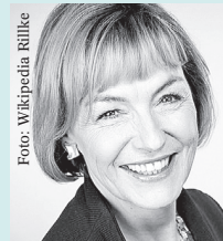
Vesna Pusić ehemalige Außenministerin Kroatiens