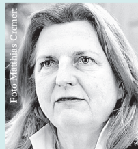
Karin Kneissl österr. Bundes- ministerin für Europa, Integration und Äußeres

Burgtheater, Universitätsring 2, 1010 Wien