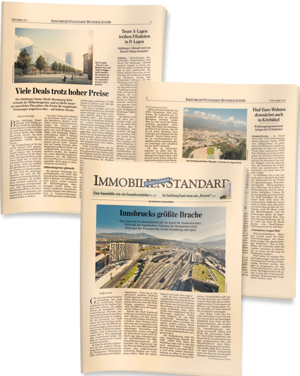
Dieses SPEZIAL liegt dem STANDARD exklusive dem STANDARD-Kompakt bei.

IMMOBILIENSTANDARD Tel.: +43(0)1/531 70-727 | Fax: DW 9727 immo.anzeigen@derStandard.at | derStandard.at/Immobilien derStandard.at DER STANDARD