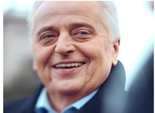
Auf dem Bild sehen Rudolf Hundstorfer.