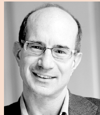
Moderation: Eric Frey DER STANDARD