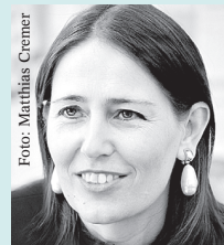
Moderation: Alexandra Förderl-Schmid DER STANDARD