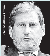
Johannes Hahn EU-Komm. Euro- päische Nachbar- schaftspolitik