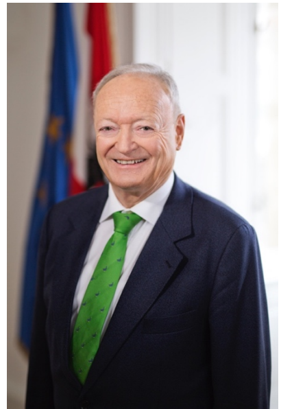
Auf dem Bild sehen Sie Andreas Khol.