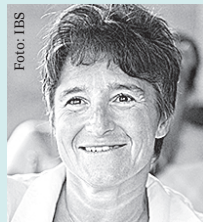
Júlia Király Ökonomin; ehem. Vizepräsidentin Ungar. Nationalbank

Eine Kooperation des Instituts für die Wissenschaften vom Menschen (IWM), der ERSTE Stiftung, des Burgtheaters und des STANDARD. Rechtzeitige Kartenreservierung und Kartenabholung vorab werden empfohlen.