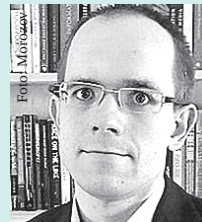
Evgeny Morozov Internetkritiker und Blogger