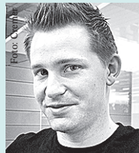
Max Schrems Jurist und Aktivist; Initiator europe-v- facebook.org