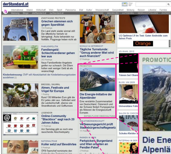
Screen 1: Promotion-Teaser auf der Startseite

Der Promotion-Teaser wird während der Laufzeit auf derStandard.at - tageweise auf der Startseite oder wochenweise im gewünschten Channel - platziert (Screen 1) und verlinkt in das Promotion-Ressort mit den gesammelten Artikeln (Screen 2).