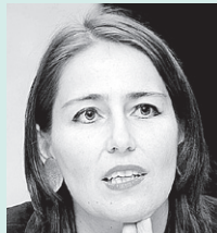
Moderation: Alexandra Förderl-Schmid DER STANDARD

In Zusammenarbeit mit dem World Information Institute