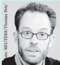
Daniel Domscheit-Berg Ex-Sprecher Wikileaks, Openleaks