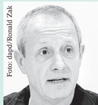
Peter Pilz Sicherheitssprecher Die Grünen