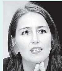
Moderation: Alexandra Förderl-Schmid DER STANDARD