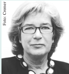
Heide Schmidt Institut für eine offene Gesellschaft