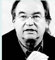
Moderation: Gerfried Sperl DER STANDARD