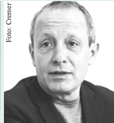
Peter Pilz Sicherheitsprecher der Grünen